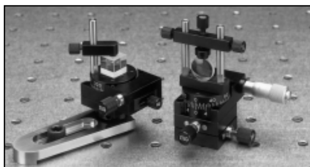
プリズムおよびレンズホルダを取付けた回転ステージ