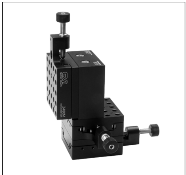
モデル 2493M X-Y-Z ステージ 2480M トランスレーションステージ×3 台、 2488 直角ブロック×1 台を使用