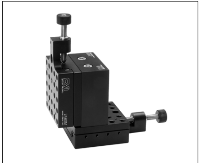
モデル 2492M X-Z ステージ 2480M トランスレーションステージ×2 台、 2488 直角ブロック×1 台を使用