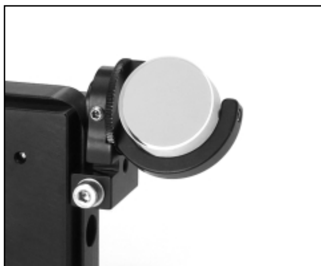
CVIメレスグリオのスーパーマウントとBシリーズ直角キャリア